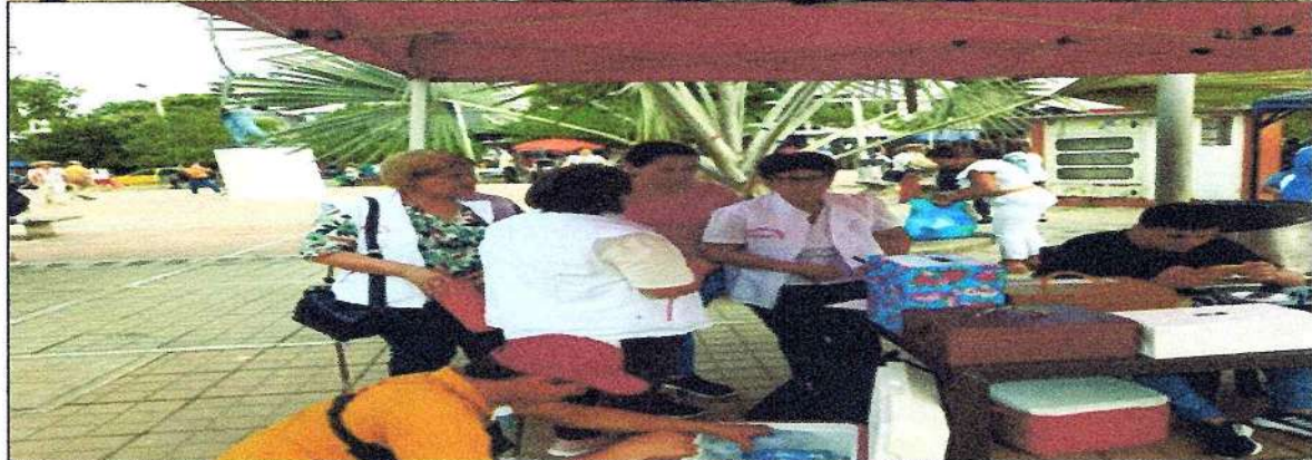
Serenata música de cuerda