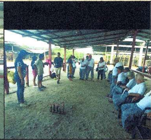
Salida educativa al seminario menor Juan Pablo II