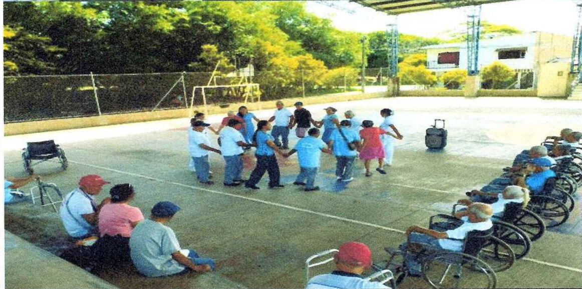
Salida lúdica a las picinas naturales