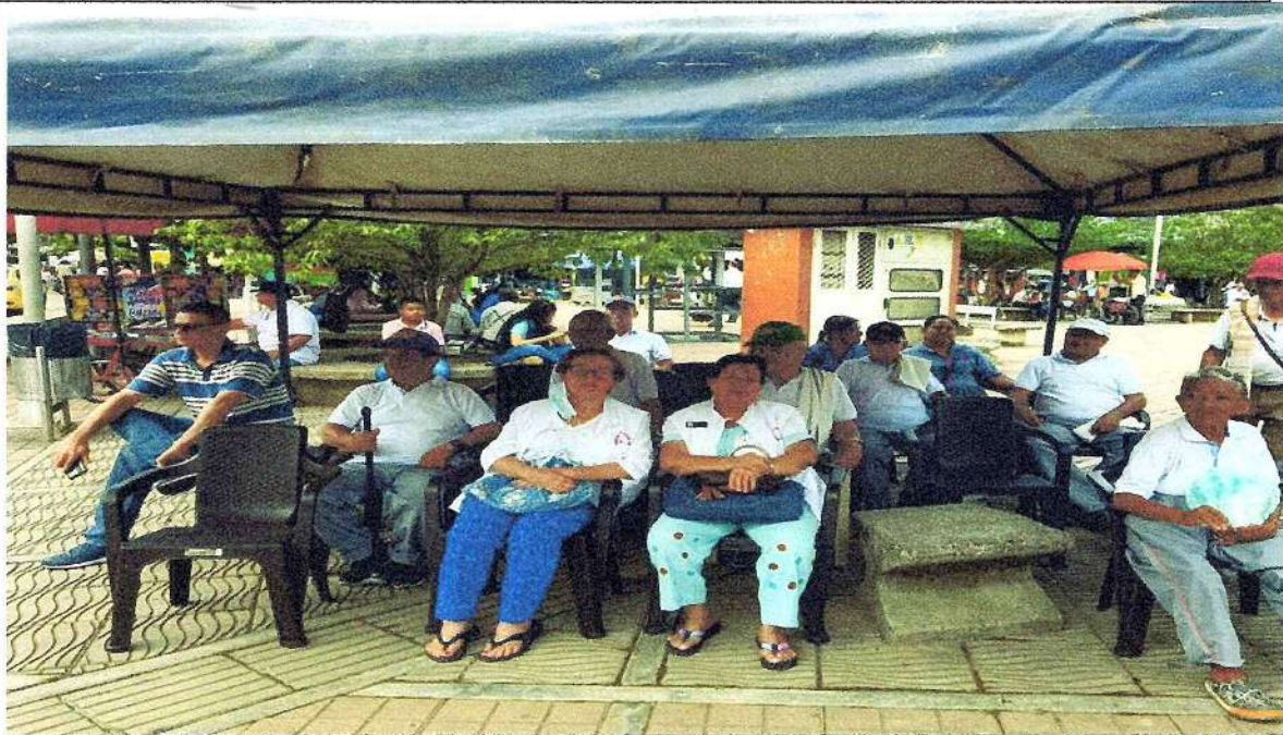
Actividad con la comunidad de San Vicente del Caguán