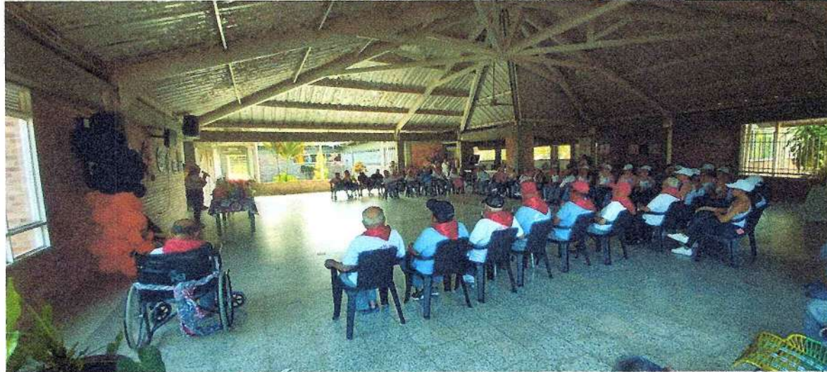
Celebración bingo comunitario