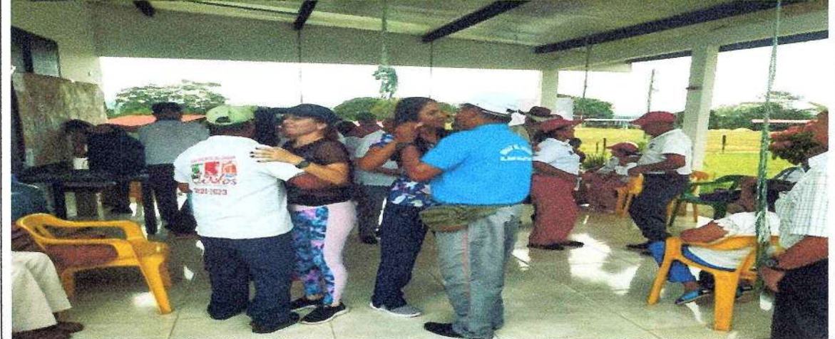
Salida lúdica rancho fernandez