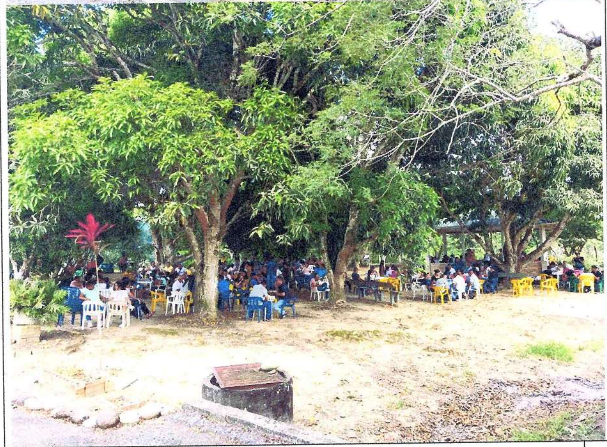
Celebración novena navideña culmina