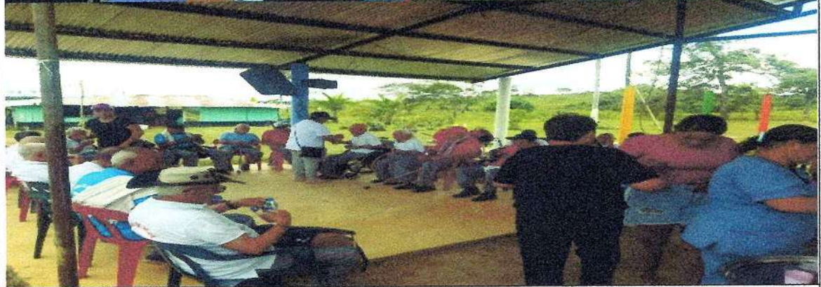
Encuentro recreativo cultural candidatas sur Colombiano