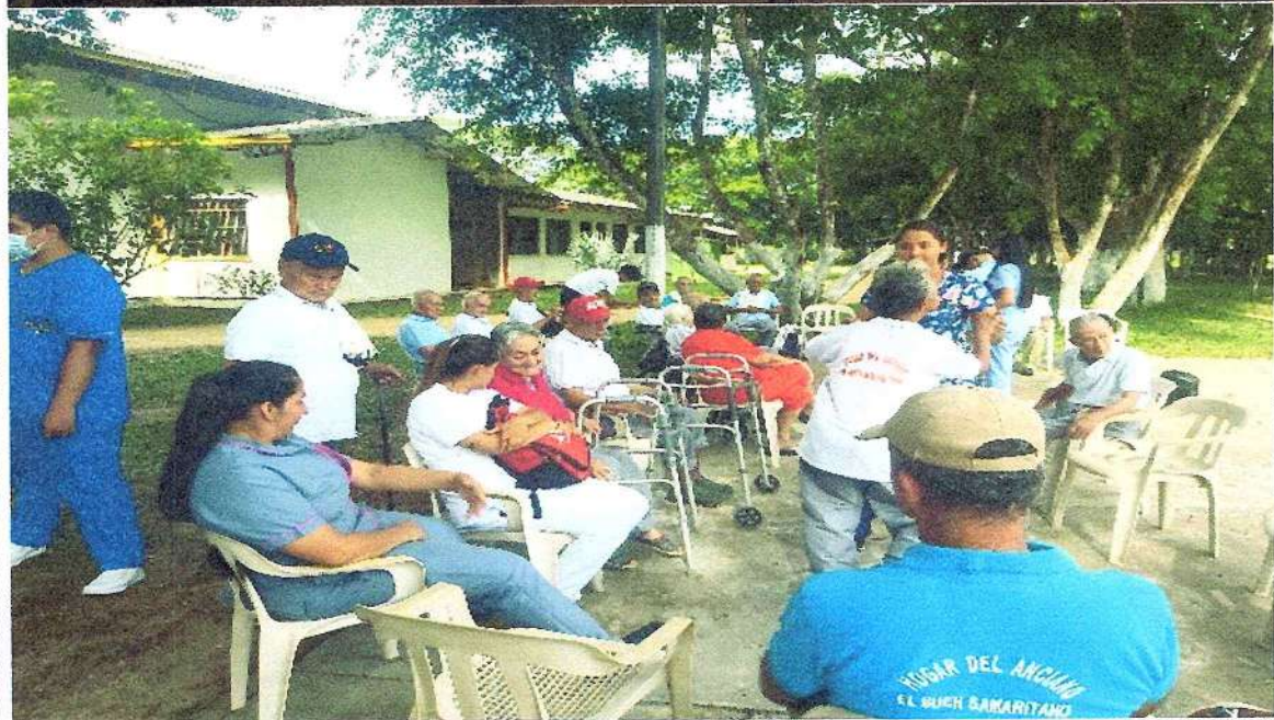
Salida deportiva al polideportivo la victoria