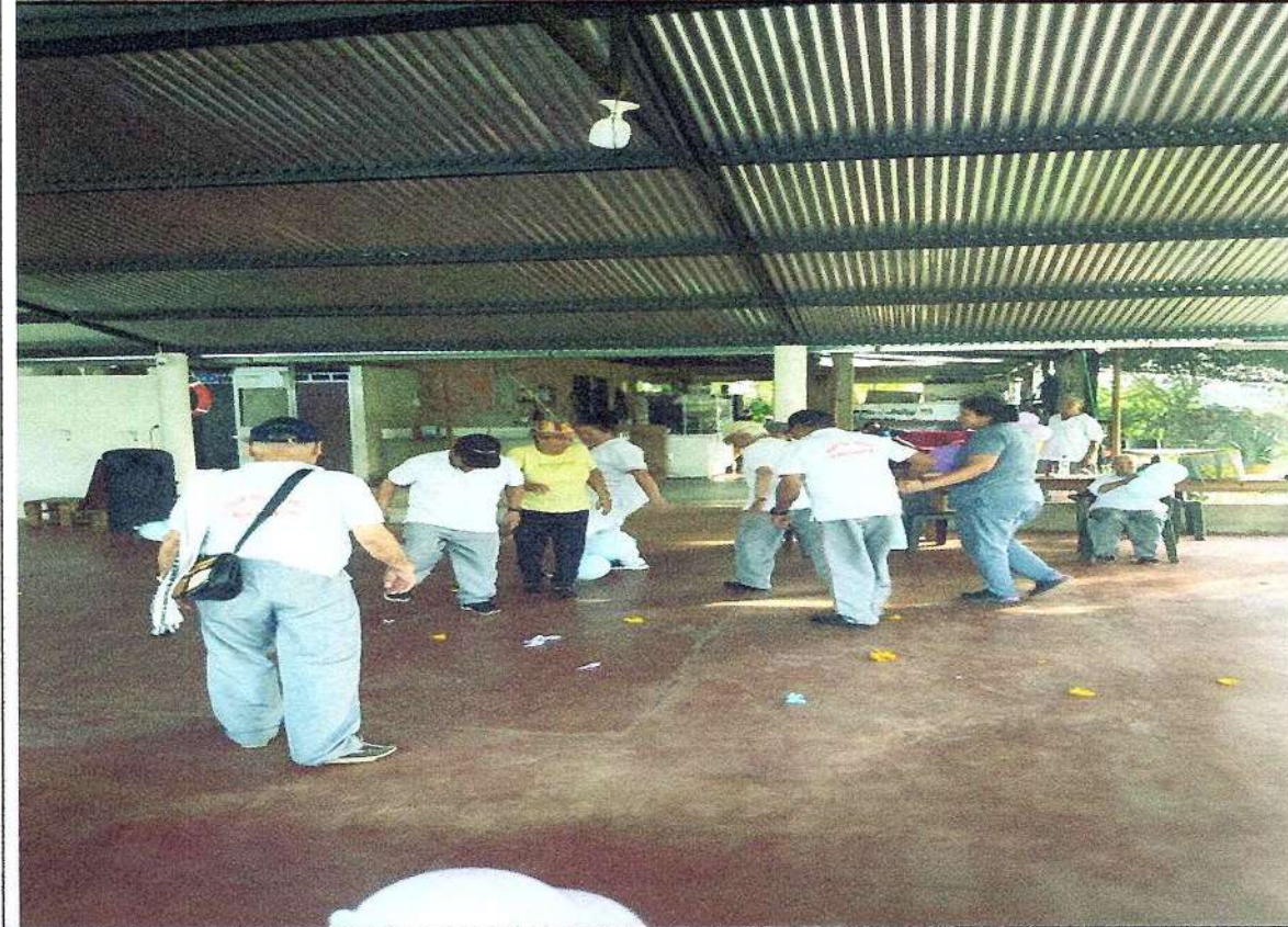
Salida cultural a la plaza de ferias