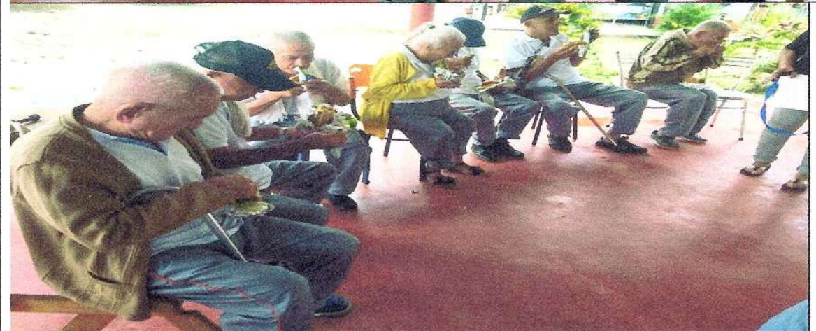
Salida cultural semana adulto mayor estadero